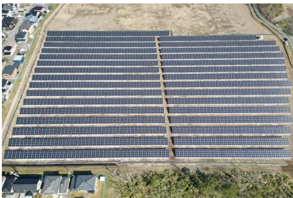
柏崎松波太陽光発電所

※1 PPA (Power Purchase Agreement：電力購入契約) とは、一般的には発電事業者（PPA 事業者ともいう）が発電設備の導入・所有・管理を自己の負担で行い、その設備で発電された電力を需要家へ長期的に提供・販売する契約スキームのこと。オンサイト PPA は需要家の設備の屋根や隣接地などの発電設備からの電力の直接の提供・販売であり、オフサイト PPA は、遠隔地の発電設備から電力系統を通じての需要家の設備への電力の提供・販売を意味します。