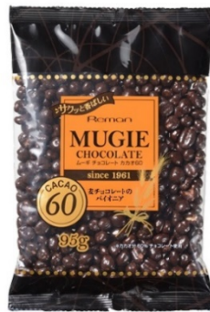
ムーギチョコレート カカオ60 95g

ムーギチョコシリーズ2品共通 価 格 : 238 円 (税込) 賞味期限 : 180 日