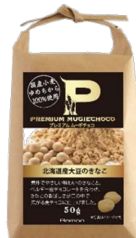
プレミアムムーギチョコ 北海道産大豆のきなこ