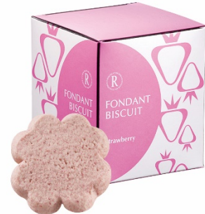
フォンダンビスキュイ 6枚 (ストロベリー)