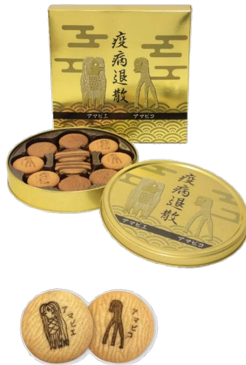
アマビコ アマビエ祈念クッキー缶

※ アマビコ アマビエ祈念クッキー缶の販売期間は、2021年4月7日(水)～5月30日(日)までです。