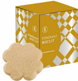
フォンダンビスキュイ 6枚 (キャラメルサレ)