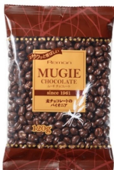
ムーギチョコレート 120g

(株)レーマンが日本で最初に麦チョコを開発した歴史があり、当時は高価であったチョコレートを手軽に食べることができる「ムーギチョコレート」を1961年に発売しました。発売以来60年近く愛され続けてきました。