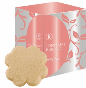
フォンダンビスキュイ 6枚 (ミルクティー)