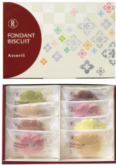
フォンダンビスキュイ アソルティ 8枚