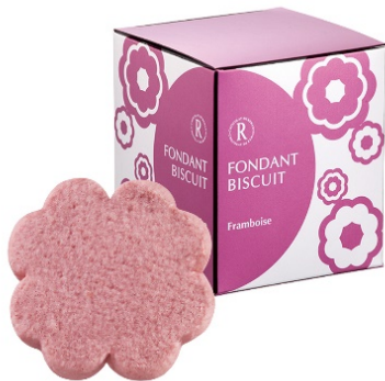
フォンダンビスキュイ 6枚 (フランボワーズ)