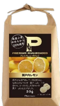
プレミアムムーギチョコ 瀬戸内レモン