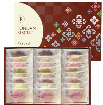
フォンダンビスキュイ アソルティ 24枚