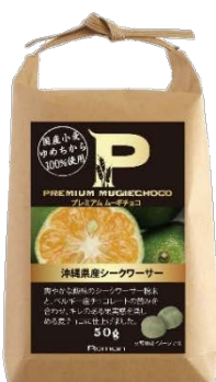
プレミアムムーギチョコ 沖縄県産シークワサー