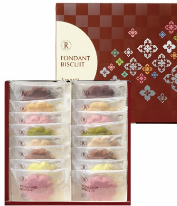
フォンダンビスキュイ アソルティ 16枚