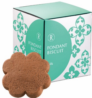
フォンダンビスキュイ 6枚 (ミルク)

チョコレートをつっぷり練り込んで焼きあげた洋菓子です。季節を問わずチョコレートのおいしさを味わっていただくことをコンセプトにしました。しあわせの象徴であるクローバーの形と、濃厚でしっとりとろける口どけは“しあわせ”を感じていただけるおいしさです。