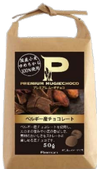
プレミアムムーギチョコ ベルギー産チョコレート

“麦”と“チョコレート”の素材やパッケージにこだわった上質感のある麦チョコです。国産小麦の「ゆめちから」を100%使用し小麦の風味がしっかり感じられるとともに、サクサクとした食感をお楽しみいただけます。また、ベルギー産のチョコレートを使用し、深い味わいの麦チョコに仕上げました。素材感を感じさせる米袋のパッケージとしました。