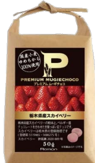
プレミアムムーギチョコ 栃木県産スカイベリー