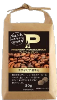
プレミアムムーギチョコ エチオピア産モカ