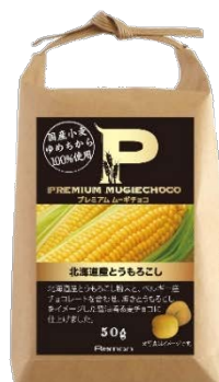
プレミアムムーギチョコ 北海道産とうもろこし