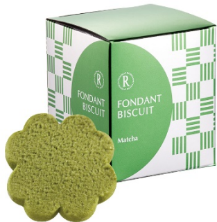
フォンダンビスキュイ 6枚 (抹茶)