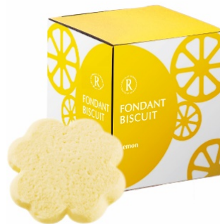
フォンダンビスキュイ 6枚 (レモン)