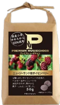
プレミアムムーギチョコ ニュージーランド産 ボイセンベリー