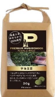
プレミアムムーギチョコ 宇治玉露