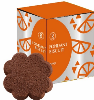
フォンダンビスキュイ 6枚 (ショコラオレンジ)