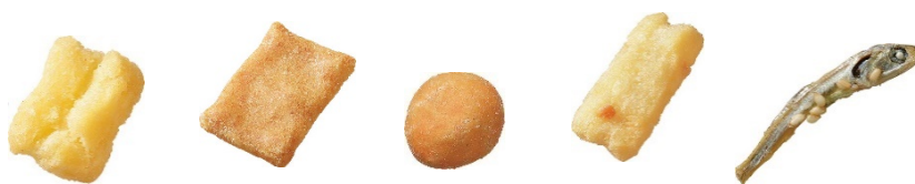
味ごのみ瀬戸内レモン風味

株式会社ブルボン（本社：新潟県柏崎市、代表取締役社長：吉田康）は、瀬戸内海の春風を感じられるレモン風味のミックス菓子「味ごのみ瀬戸内レモン風味」を2022年5月までの期間限定で、2022年3月15日（火）に販売開始いたします。