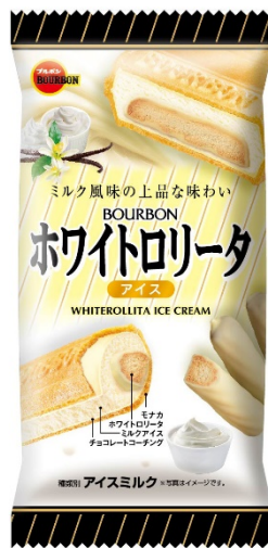
ホワイトロリータアイス