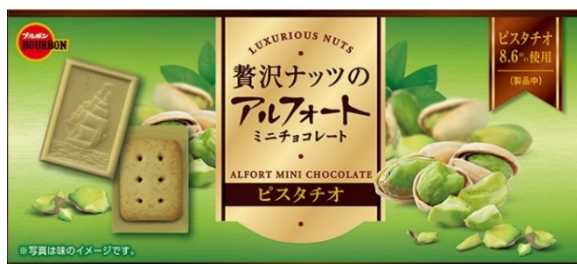
贅沢ナッツのアルフォートミニチョコレート ピスタチオ