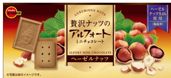
贅沢ナッツのアルフォートミニチョコレート ヘーゼルナッツ