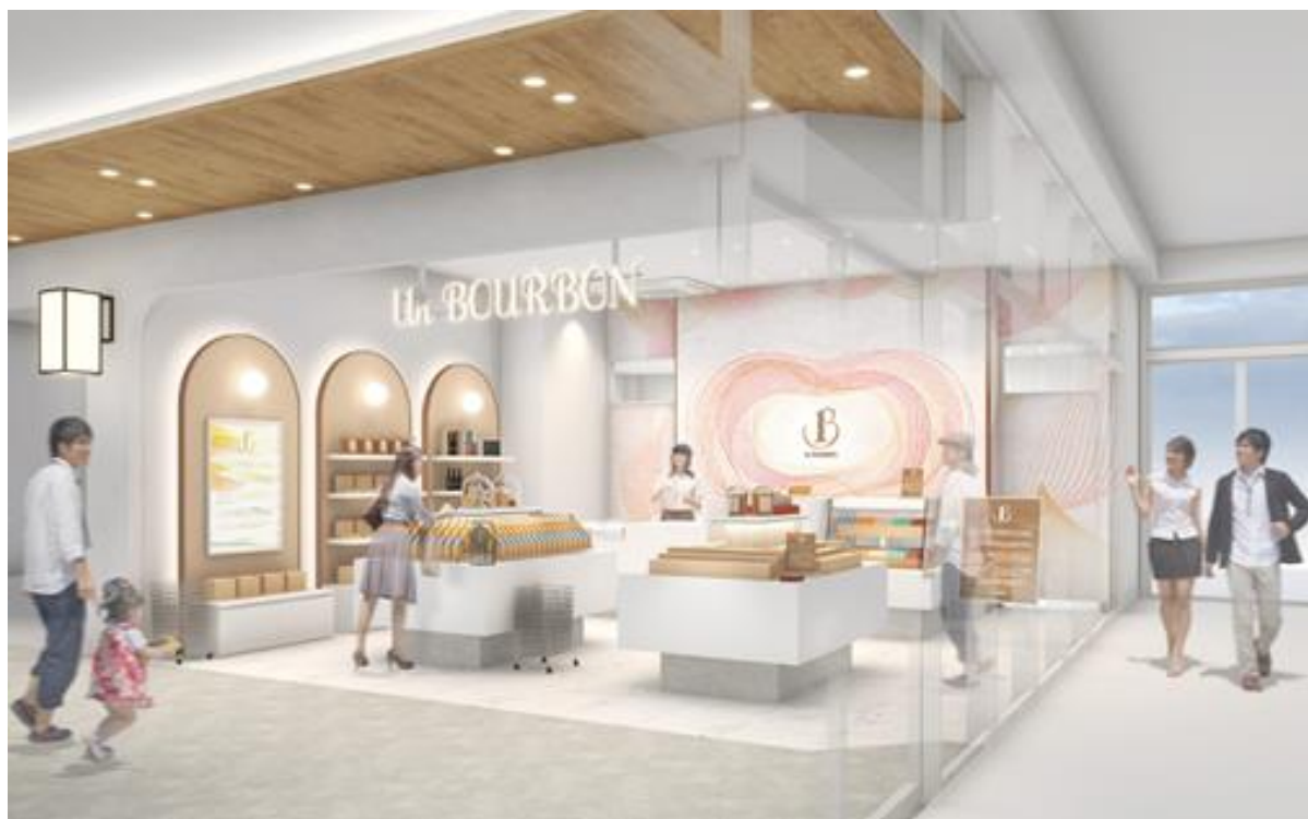
BOURBONコンセプトショップ 「Un BOURBON」ショップイメージ