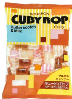
発売当初の商品画像

また、キュービイロップは“1粒2g”を目安としており、これはハードキャンデー1gを食べるのに平均2分かかると言われていることから、素早く食べられることを目指した設計としています。こうしたキャンデーの設計は、お客様から「小さな子どもに与えても『喉つまり』の心配が少ない」とのお声も多くいただきました。キュービイロップは当社のロングセラーキャンデーとして、これからも皆様にカラフルなおいしさをお届けしてまいります。