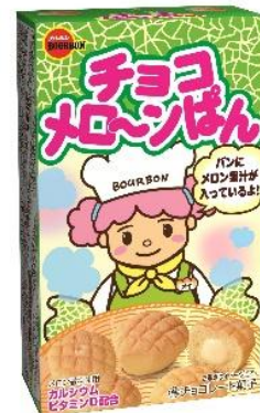
過去のシリーズ商品（一部）