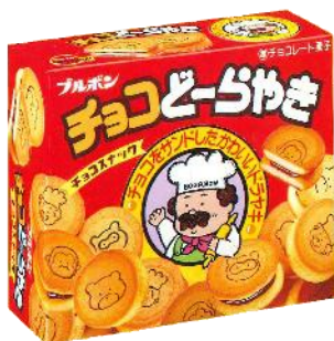
発売当初の商品画像

また現在は、カルシウムとその吸収を助けるビタミンDを配合しており、これからもみなさまに口を大きく“あ〜ん”と開けて食べていただきたい商品です。