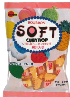
過去のシリーズ商品（一部）