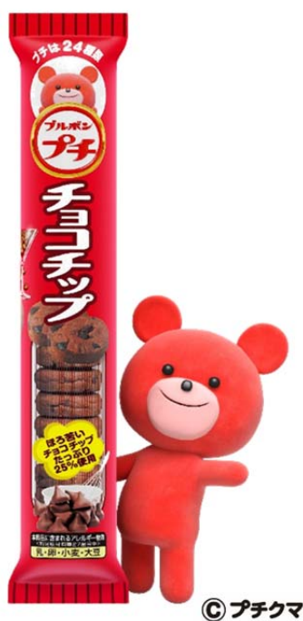
プチチョコチップとプチクマ